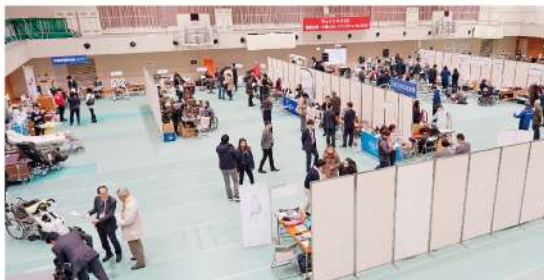
※令和元年度のフェスティバルの様子