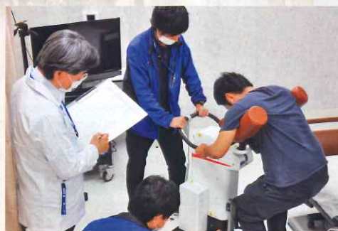
ロボットの開発や新規参入について、医療・介護・工学の専門家が開発のお手伝いをします!